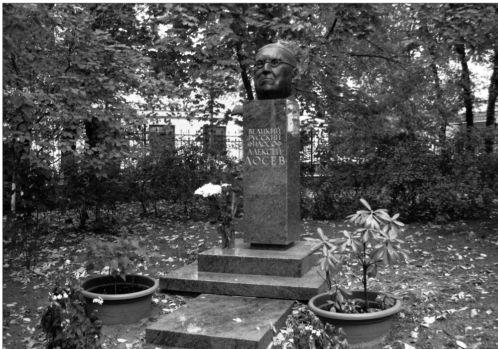
Ил. 2 | Памятник А. Ф. Лосеву во дворе «Дома Лосева»

продиктованном им ко Дню славянской письменности, — «Реальность общего. Слово о Кирилле и Мефодии», о высоком единении философии (любомудрия) и филологии (любословия), о слиянии истины с любовью.